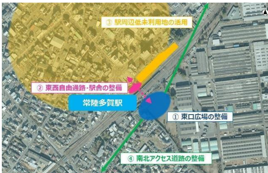
図 常陸多賀駅周辺地区整備計画（R2.3）より