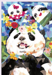
令和7年度受賞作品