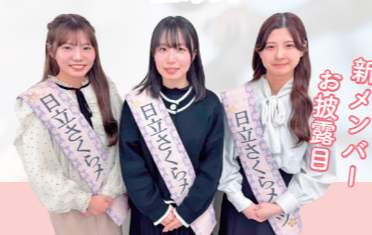
新メンバーお披露目!