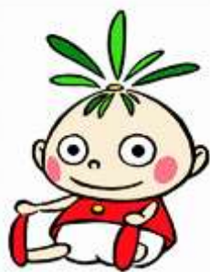
十王図書館 キャラクター テンちゃん