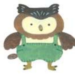
記念図書館 キャラクター キトちゃん