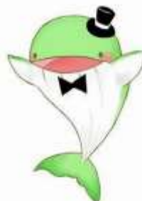
南部図書館 キャラクター くじらちゃん