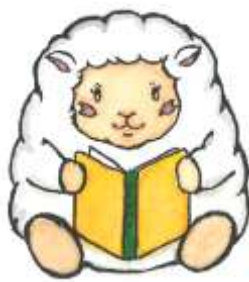
多賀図書館 キャラクター ふわふわちゃん