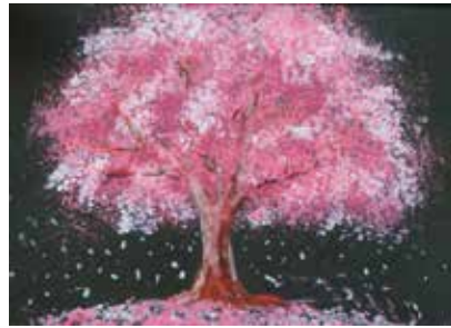
記念図書館の展示 (2024年)