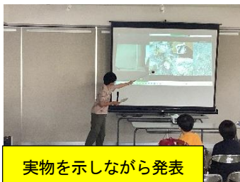
実物を示しながら発表