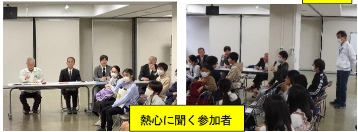
熱心に聞く参加者