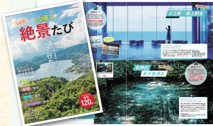
日立駅が絶景スポットとして紹介されています。