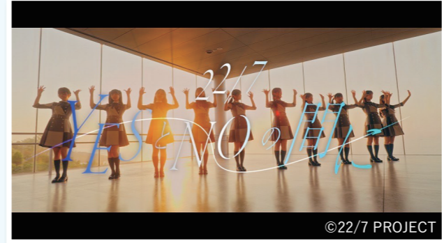
日立駅での撮影を記念して、メンバーの等身大パネルなどのパネル展が同駅にて期間限定で行われました。