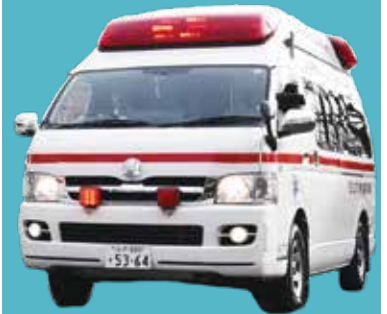
*救急車の有料化ではありません。

昨年の茨城県の救急搬送件数は過去最多を更新し、6割以上が大病院に集中しています。その半数が軽症であり、救急医療現場が今後更にひっ迫すれば、本当に救急医療を必要とする方の救える命が救えなくなる事態が懸念されます。 このため、茨城県では、12月2日(月)から、救急車を呼んだ時の緊急性が認められない場合に限り、対象となる大病院(日立市内では日立総合病院が対象)で選定療養費の徴収を開始します。