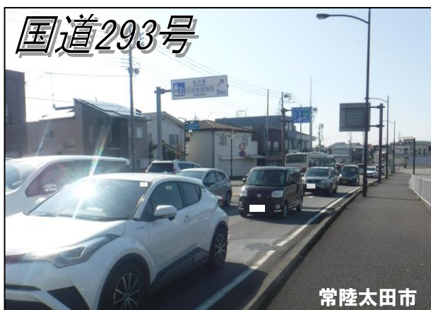
日立都市圏の位置