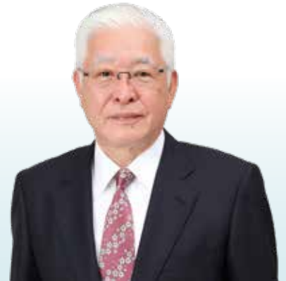
日立市長 小川 春樹

人口減少や少子高齢社会の進行、頻発する自然災害など、私たちを取り巻く環境には課題が山積しておりますが、本市民の皆様誰もが幸せを実感できるまちづくりを実現するため、より一層議論を深めてまいります。