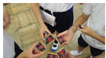
マイクロビットじゃんけん