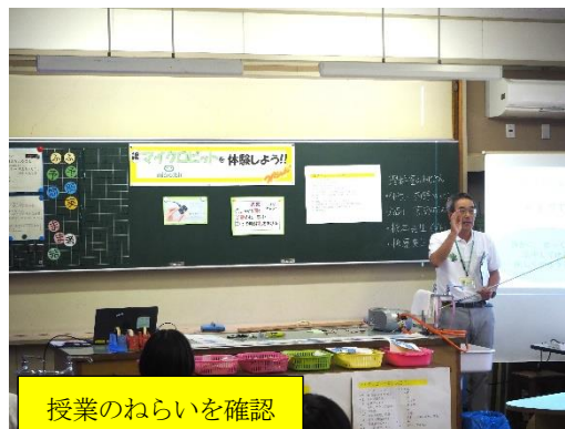
授業のねらいを確認

本日の授業では、児童17名に指導者が4名いたことでスムーズな授業ができたと思われれます。まだまだ、課題は多くありますが、今後の展開に向けて大変充実した研修会となりました。