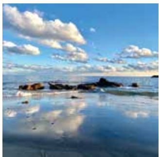
穏やかな時はこんなに美しい風景が広がることも(会瀬)