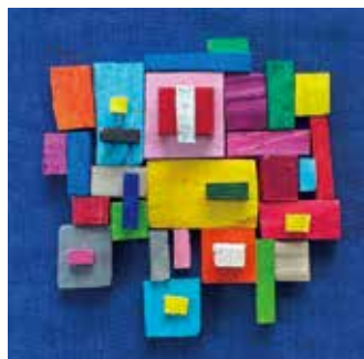
【流木つみき】拾った流木が生まれ変わりカラフルな作品に