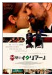
「幸せのイタリアーノ」