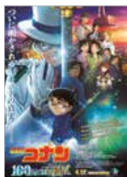
「名探偵コナン 100万ドルの五稜星(みちしるべ)」