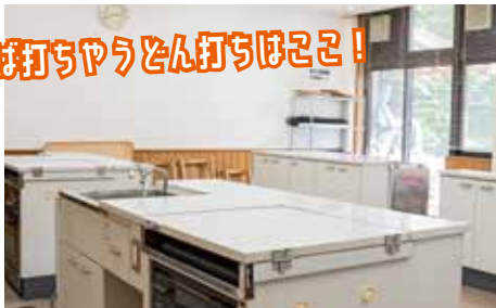
郷土料理体験教室

たかはら自然塾では、高原小時代の家庭科室や図工室が利用できます。事前の申込みで、講師の方から教わるさまざまな体験（4ページ参照）ができます。 料金（2時間） 840円 夜間1,050円