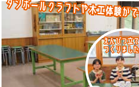
伝統工芸体験教室