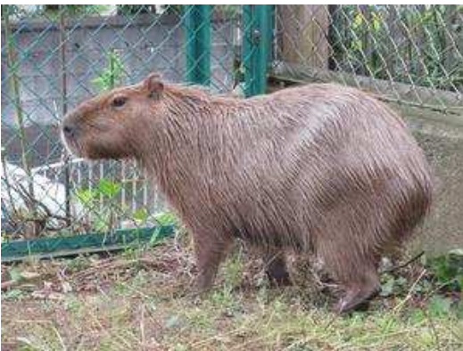
(引っ越してきたセリナ♀)