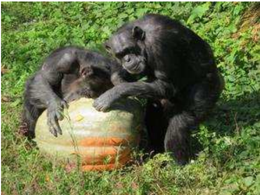
カボチャの中のものを取り出しているゴヒチとヨウ。