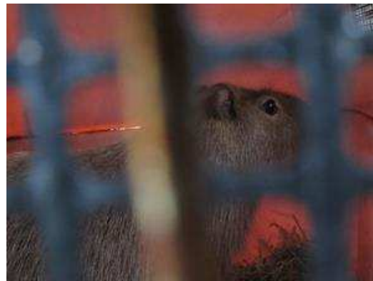
(移動中。じーっとしていました。)

初めての長旅を経て、かみねに到着しその日は隔離舎にお泊り。緊張して自分からケージを出て来てくれないかなと心配していたのですが、自分からケージを出て部屋に入ってくれました。意外と落ち着いていたのかなと一安心。あとは、ビビリンと良い関係を作ってくれば…。