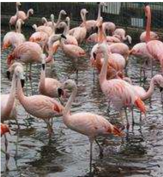
写真：一本足いるかな？