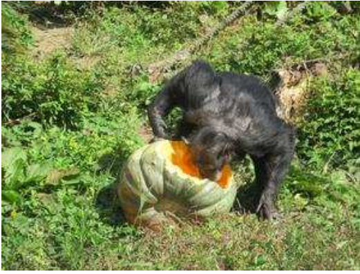
マツコは割って中身をゲット！