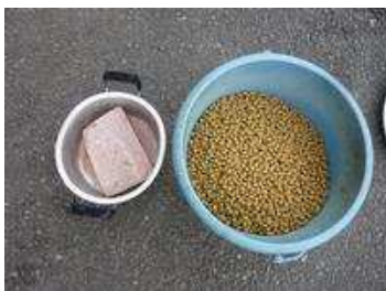
写真：右 オキアミ 左 フラミンゴ専用フード