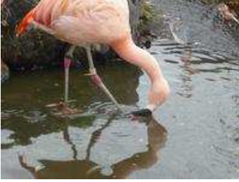
写真：食事中のフラミンゴ

いかがでしたでしょうか。少しでもフラミンゴのとくちょうを伝えられたならば幸いです。ご来園の際にはぜひ観察してみてください！