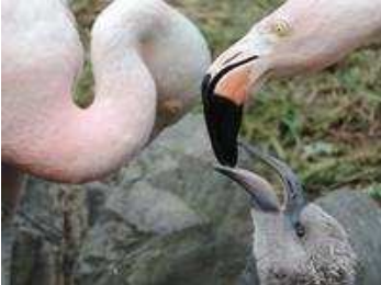
写真：フラミンゴミルクをねだっているヒナ

フラミンゴのヒナは親からフラミンゴミルクをもらいます。 当たり前を書きましたがびっくりですよ。 このフラミンゴミルクは、脂肪やたんぱく質が豊富です。 さらに親の血液も含まれていて、徐々にヒナはピンク色になっていきます。 与える期間は約3か月ですが、当園にいる1歳のヒナはいまだに親にねだっている姿が観られます。 ちなみに親はフラミンゴミルクに血液を使うため、ピンク色が少しずつ抜け白っぽくなります。 ちなみにちなみに♂親もフラミンゴミルクを与えることができます。