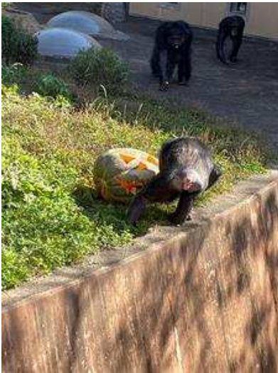
試行錯誤して取り出そうと奮闘中なマツコ。