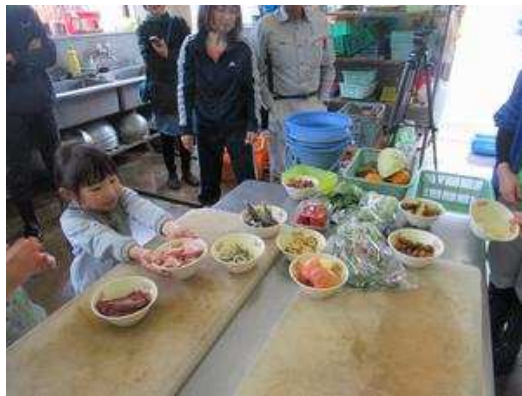
<色とりどりの食材>