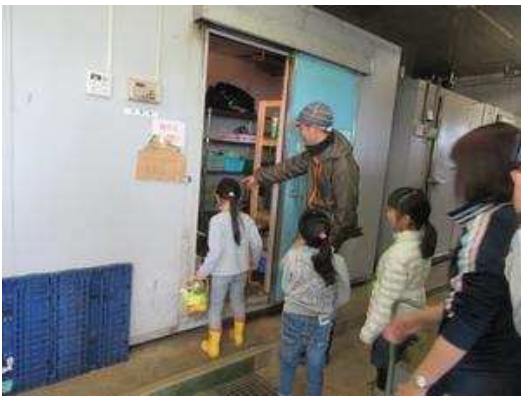
<冷蔵庫から食材を選びます>

最後は雑食チーム。雑食は肉や魚、果物、野菜とバリエーション豊かなえさを作りました。えさはチンパンジーとアライグマにあげました！