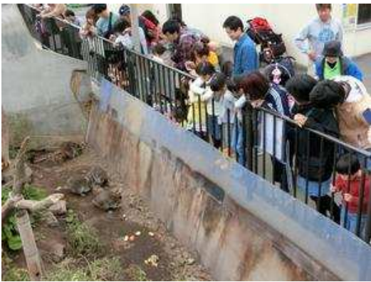
<アライグマは何が好き？>