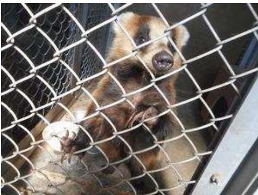
<フェンスから飛び出る長い爪>