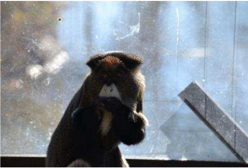
フサオマキザル「ゲンキ」君