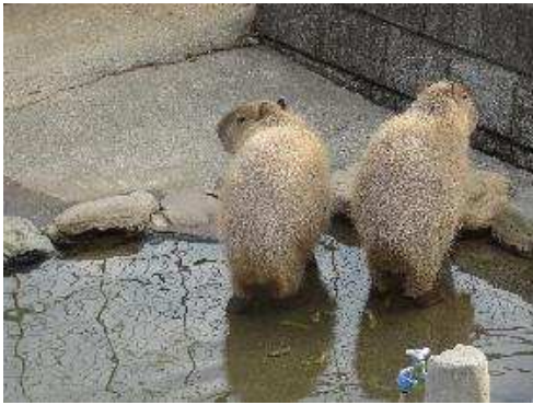
2頭で仲良くトイレ中