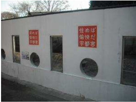
他の動物舎にも、宣伝？らしき文字が。