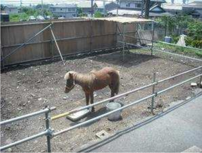
撤去した跡地をミゼットホース（さっちゃん）の遊び場に。