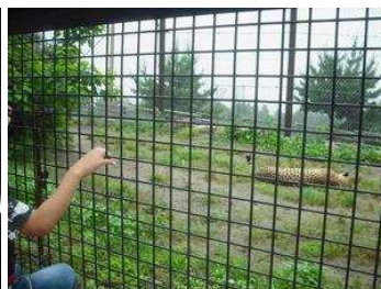
チーターが目の前で…