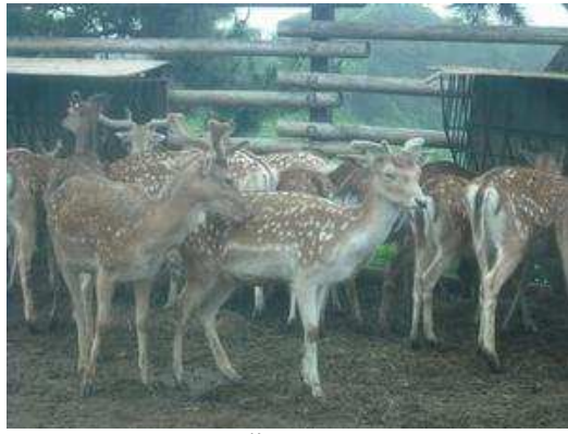
シカも群れています。