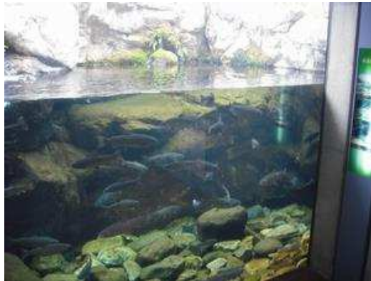
エスカレーターで下ると、那珂川の上流から下流の魚たち