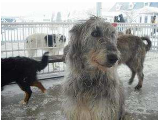
もちろん触れ合うことも