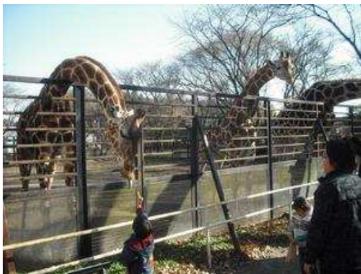
「キリンさん、どうぞ」