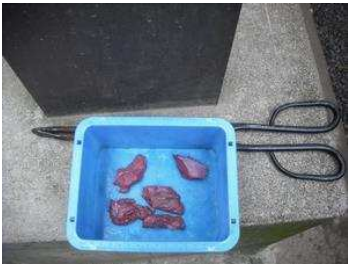
初体験。ライオンさんにご飯を。