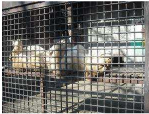
当園からお嫁入りしたライオン「ミミー」も元気そう