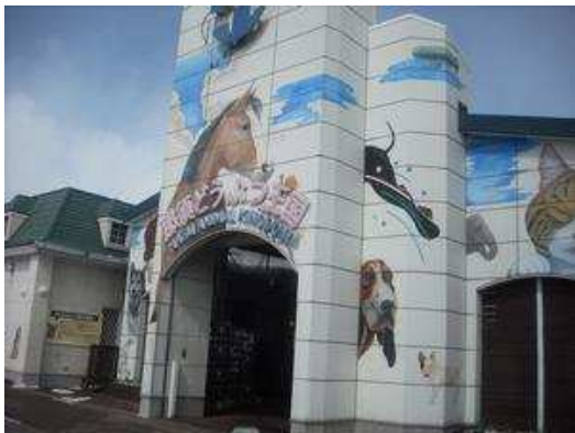
那須どうぶつ王国入口