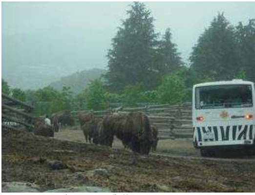
バイソンが群れています。