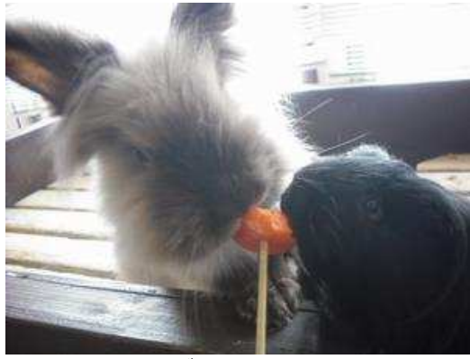
ウサギとモルモットに