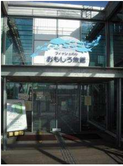
なかがわ水遊園入口