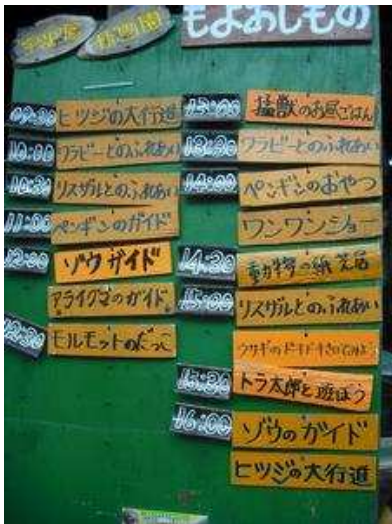
入口にあるイベント案内をチェック。