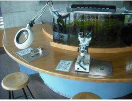
小さな生物も観察できます。