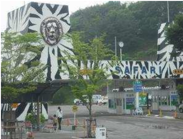
サファリパーク正面ゲート（マイカーでスルー）