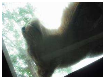
ライオンが頭上で…