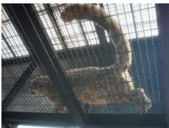
ユキヒョウが頭上で…