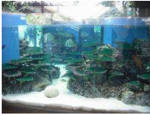
きれいな魚たちがお出迎え