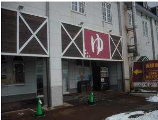
疲れたらひとつ風呂