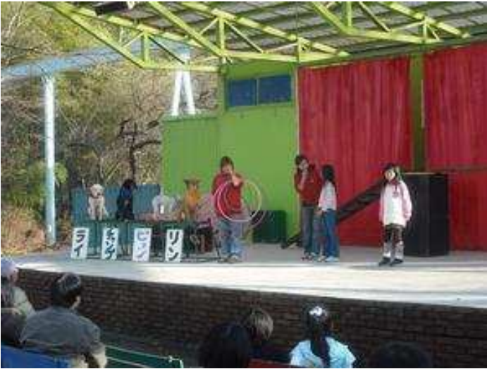
ドッグショーもやってました。

エサやりコーナーなどは、結構、自由な感じで行うことができました。 スタッフの皆さんも元気な感じでした。