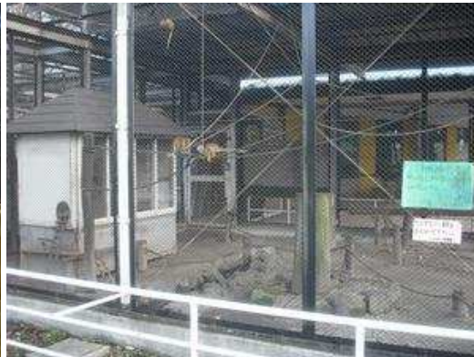
ふれあいコーナーでは、ポニー乗馬も。時間があえば、リスザルとのふれあいも。