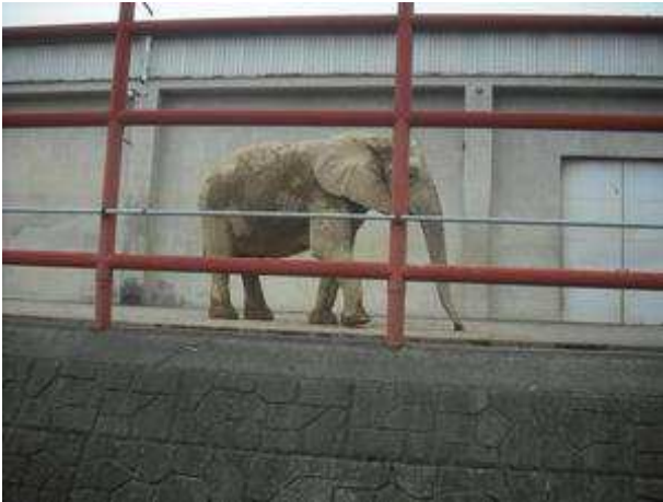
ゾウさん。 いらっしゃったのは「アフリカゾウ」でした。