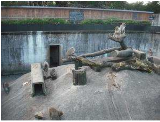
サル山をよく見ると…