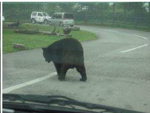
そこは野生…「クマさん通過中」