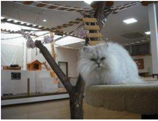
一匹だけジューっとガンつけてました…。