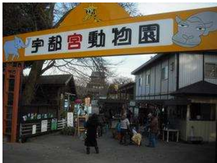
宇都宮動物園入口