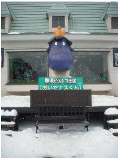
マスコット「おいでナス」君