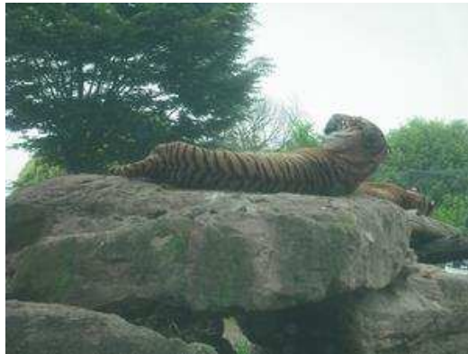
群れるライオン、くつろぐトラ。決して窓は開けないように…。