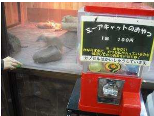
珍しい「ミーアキャット」のおやつ。