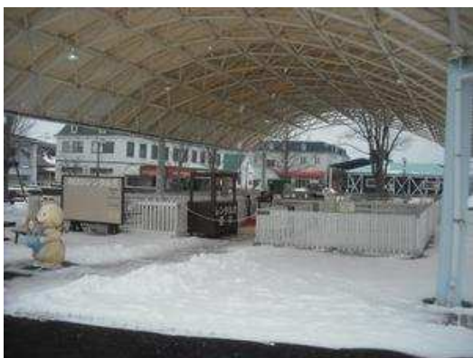
ワンちゃんたちと散歩ができます。