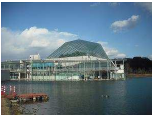
なかがわ水遊園外観。