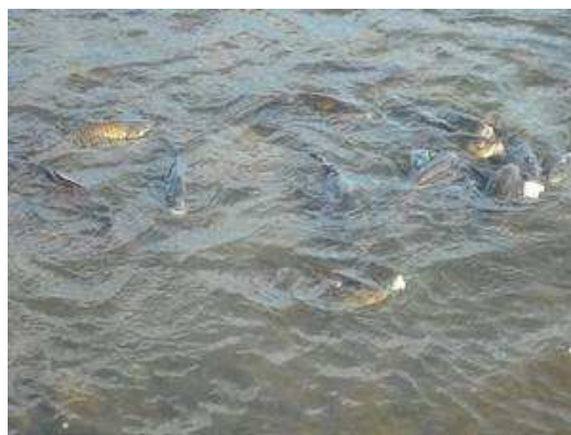
池にはたくさんのコイたちがエサをまっています。

淡水魚だけではなく、海水魚も展示されていました。 帰りは、近くの売店で鮎の塩焼きをガブッ。