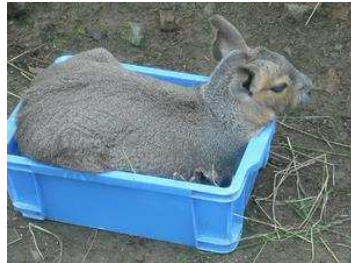
途中、車を降りてウォーキング。 ふれあいコーナー（モルモット）