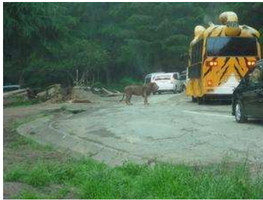
再び車に乗り猛獣ゾーンへ。ほんとにホントに（ちょっと園が違いますけど…）