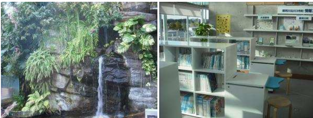
トンネルを抜けると熱帯の風景。 分からないことがあったら図書コーナーで勉強しよう