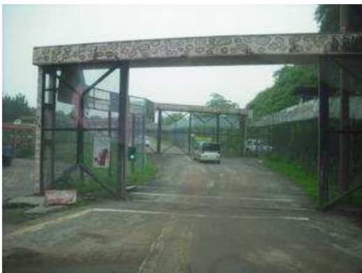
二重ゲートを抜けると…