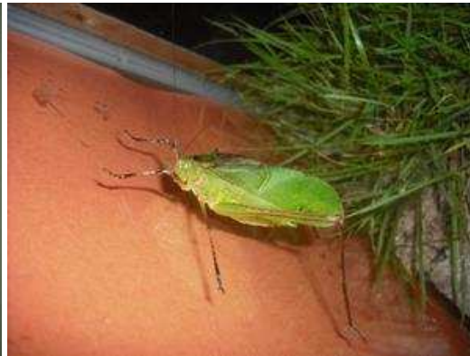
自分も初めて見ました。「クツワムシ」