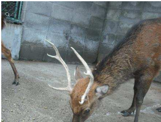
平成22年8月29日（落角後141日目）完成