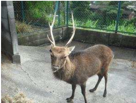
平成22年9月17日 現在のヤクンです。今が角の見ごろです。