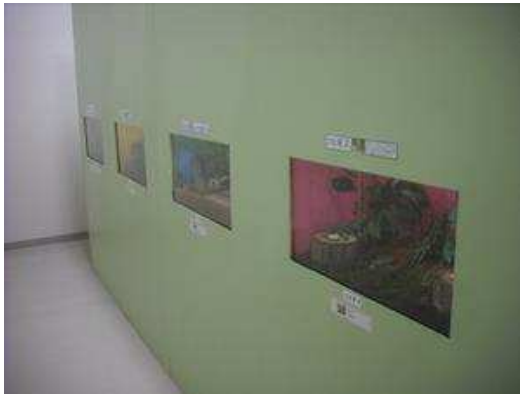
身近で見られる様々なバタたち