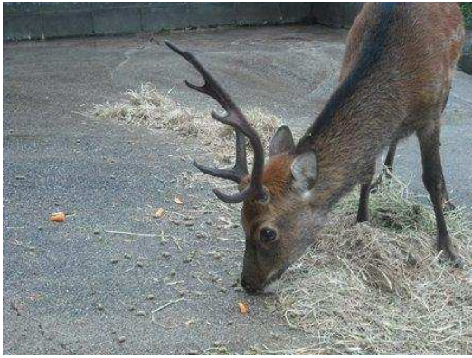
平成22年8月15日（落角後127日目）