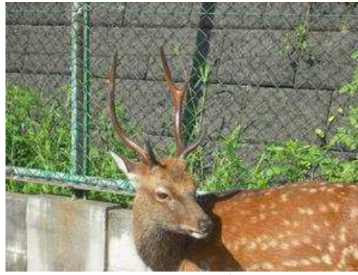
平成22年6月13日 2回目の枝分かれ始め。 平成22年8月8日 完全に伸びきったようです。