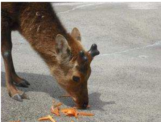
平成22年5月9日 1回目の枝分かれ始め。