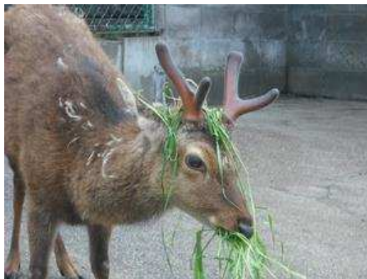
平成22年5月29日2本目が終わりそうです。