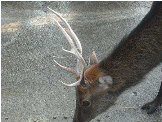
平成22年8月23日（落角後135日目）