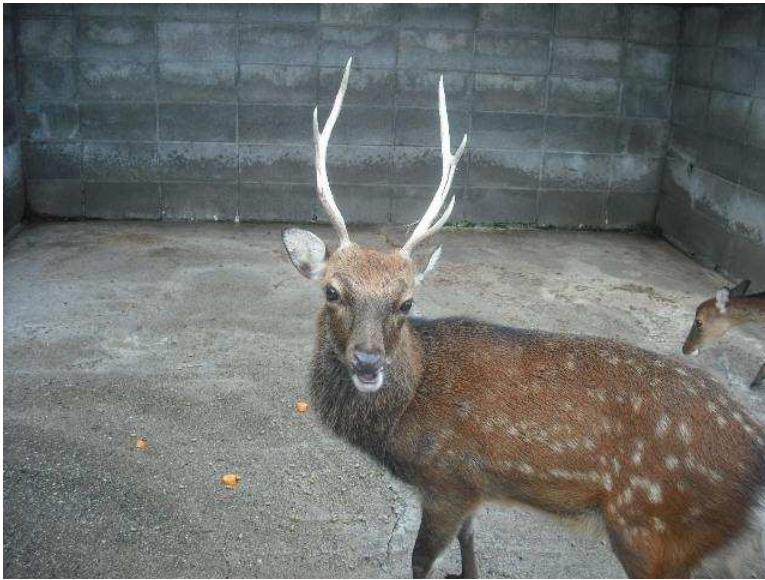
「飼育員、かかってこーい」

平成22年8月4日、11日にゾウさんペーパー教室がおこなわれました。 ゾウさんのうんちから、うまく紙ができるかな？