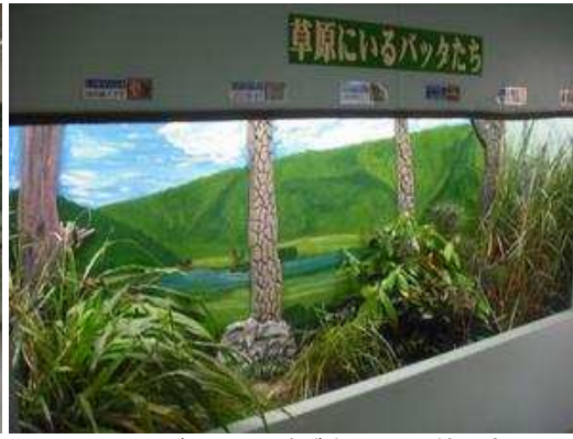
トノサマバタなどが大量?に放し飼い