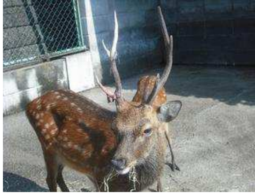
平成22年8月11日 袋角が固くなってきました。 平成22年8月22日 袋角がはがれ始めました。