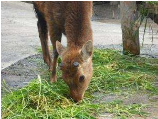
平成22年4月19日 伸び始めました。