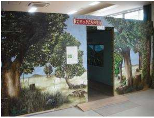
動物資料館内のバタ特設会場