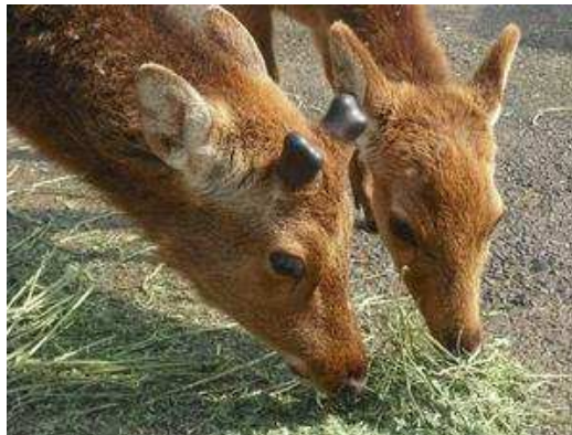
平成22年5月5日 1本目が終わりそうです。