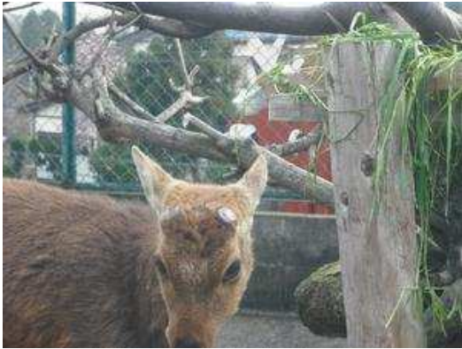
平成22年4月11日 落角しました。