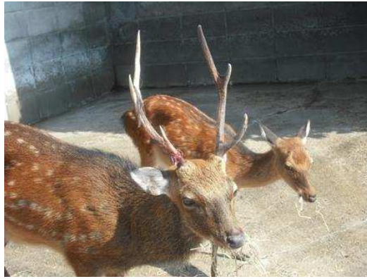
平成22年8月22日（落角後134日目）袋角がはがれ始まる