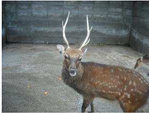
141日後 平成22年8月29日 完成です。