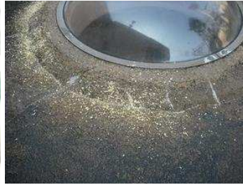
わくわくドーム付近

おやつはサツマイモ、ニンジン、パン、リンゴなどなどで開園すぐの方がよく観察できます。