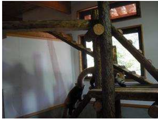
ネコのように目の前を駆け抜けていきました。