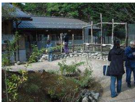
たくさんのパンダが近くで見れました。