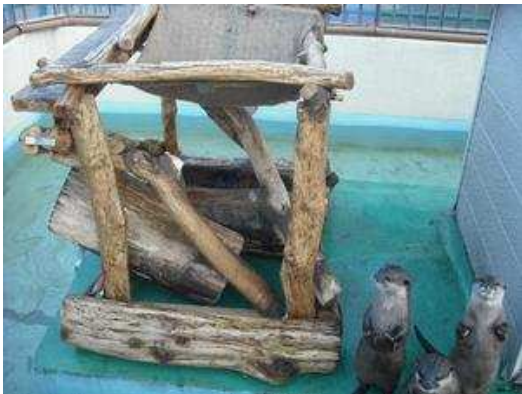
手作りハンモック（側面）