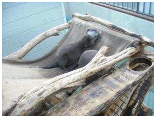
すりすり「きもちい〜」