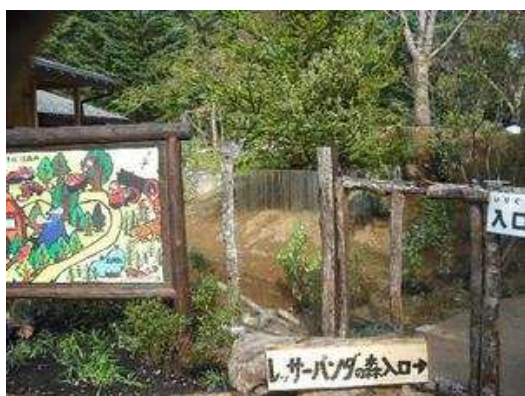
レッサーパンダ屋外展示場