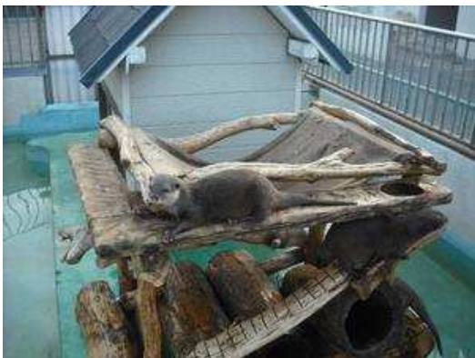
近くで見れますが、手は出さないでね。