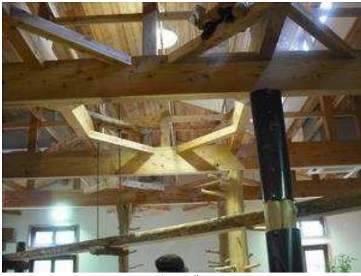
レッサーパンダ屋内展示場