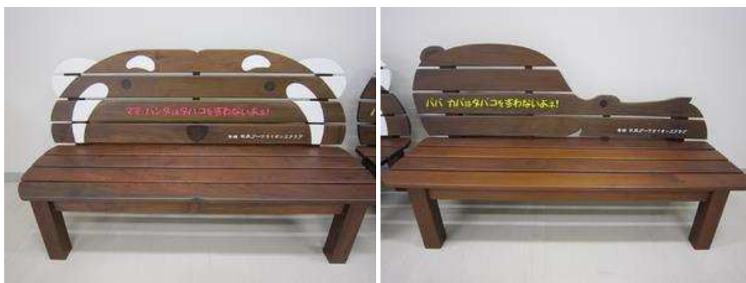
レッサーパンダ型ベンチ

ブーケライオンズクラブ様よりかわいいベンチが寄贈されました。ありがとうございます。