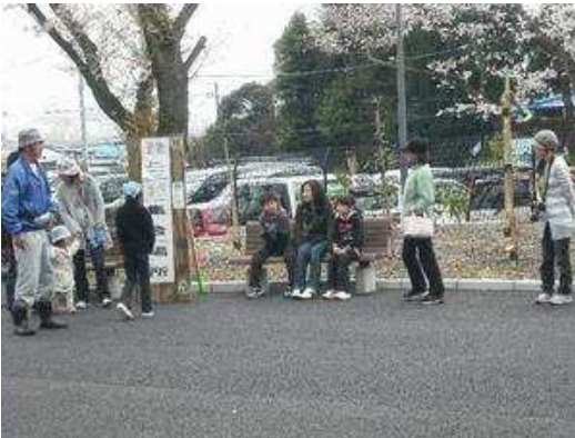
園内ガイド出発前

4月19日は語呂合わせで（しいくの日）、ということで園内ガイドを行いました。 平日の午後ということもあり、内心「参加者いるのかなあ？」と不安でしたが、思った以上？にお集まりいただき、がぜん、やる気アップ。（90分の予定が120分）