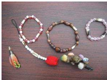
ヤマアラシのプレスレット