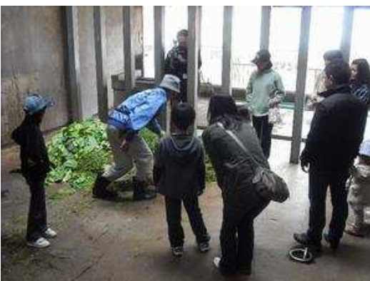
ゾウ舎寢室。「これが本日の夕ごはんです」

ゾウ舎前集合から、ゾウ舎寢室と給餌体験、ニシキヘビタッチ、チンパンジー舎屋内展示場と屋上テラス、カバ舎寢室とクロサイ給餌体験、キリン舎寢室、ライオン舎寢室の順にご案内させていただきました。