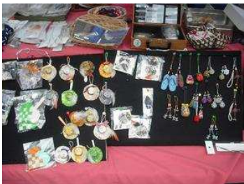
色々なオリジナルグッズ

商い中は、ぜひ、立ち寄っておばちゃん（おじちゃん）のぬくもりを感じてみてください。