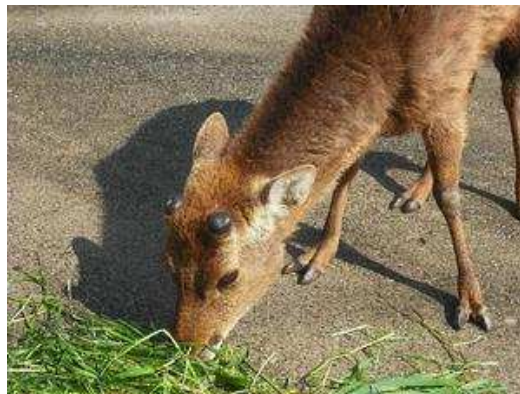
平成22年4月24日 14日目 盛り上がってきました