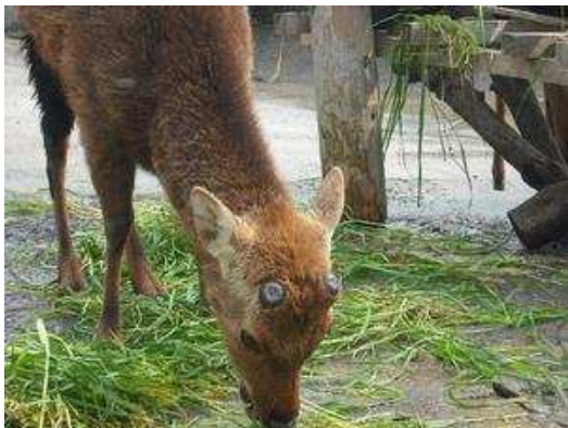
平成22年4月17日 落角後7日目