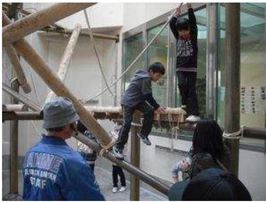
チンパンジー屋内展示場。「チンパンジーより楽しんでる？」