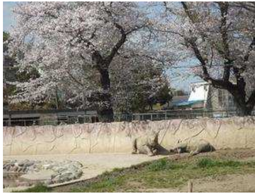
クロサイ親子と桜