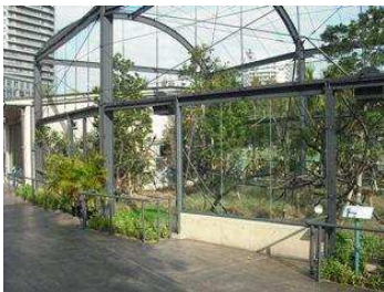
キツネザルやアイアイの森