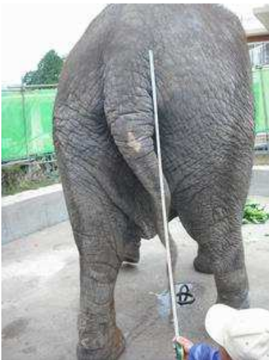
しっぽの長さは約120センチでした。