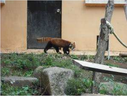
「ふうた」君と思われる。