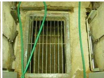
寝室と運動場を分ける通路