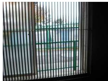
左からエサ箱、寝台、出入り扉 室内から外の眺め（鉄格子越し）

飼育員の出入りする扉には3か所のロックが付いているので、開けて逃げることはまず不可能。