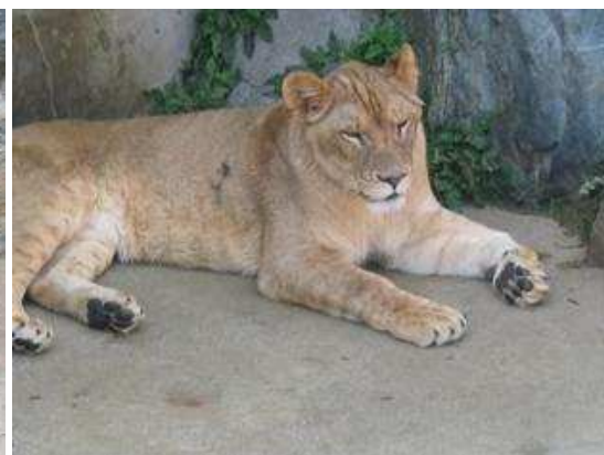
お母さん（バルミー）