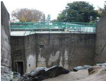
ライオンからの目線