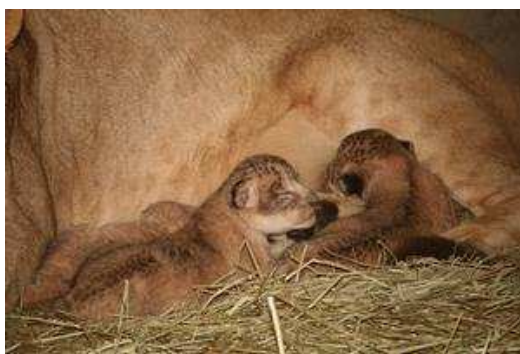
平成21年10月8日 ライオンが誕生しました。 (一般公開はもう少し先です)