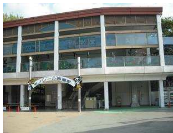
園内を走るモノレール