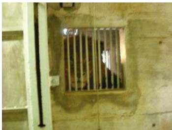
ウィルの顔デカッ