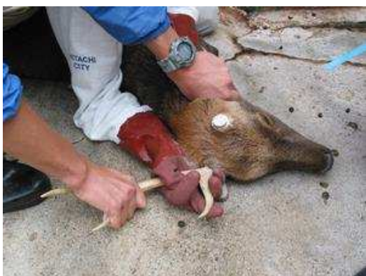
平成21年10月25日 シカの角きりを行いました。