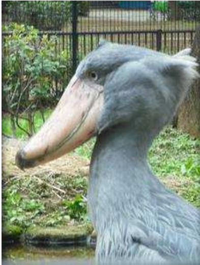
個人的には「ハシビロコウ」が好きです。