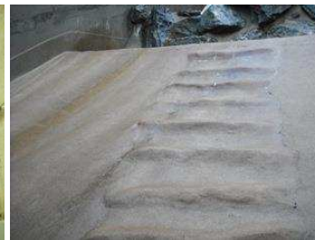
運動場に出ると急斜面

運動場はピット式（掘り込み形式）のため、柵のない状態でみることができますが、実際よりも動物が小さくみえてしまいます。部屋の中にいるときは超アップ。さすがの迫力です。