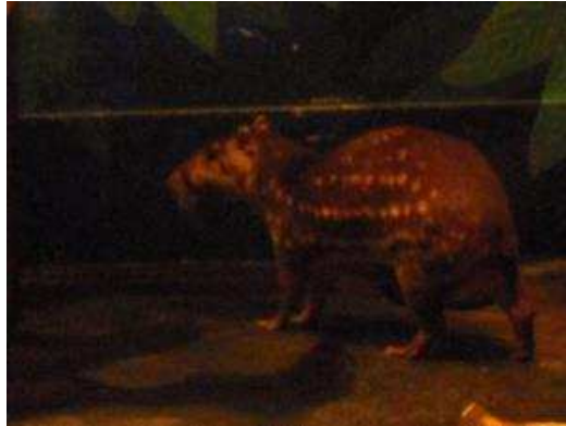
夜行館にいた「パカ」もなかなかいい感じ。