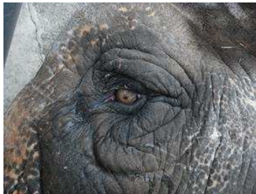
では、目の大きさは？