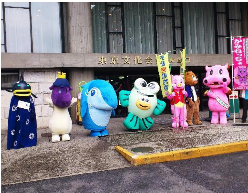
北関東&福島のスター全員勢ぞろい

全員が集合し記念写真をパチリ、と収めると早速子供さんたちが集まってきました。この日は、上野動物園でパンダの赤ちゃんが生まれた最初の日曜日、ということもあって結構な人出が。パンダは残念な結果となってしまいましたが、それでも父親だけでも見たいという人たちがずいぶん来園されたようです。まさにパンダ効果。