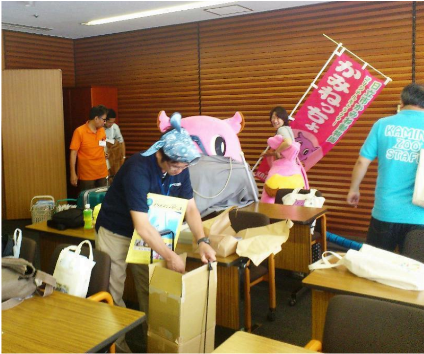
こっそり潜入、だれにも内緒だよ