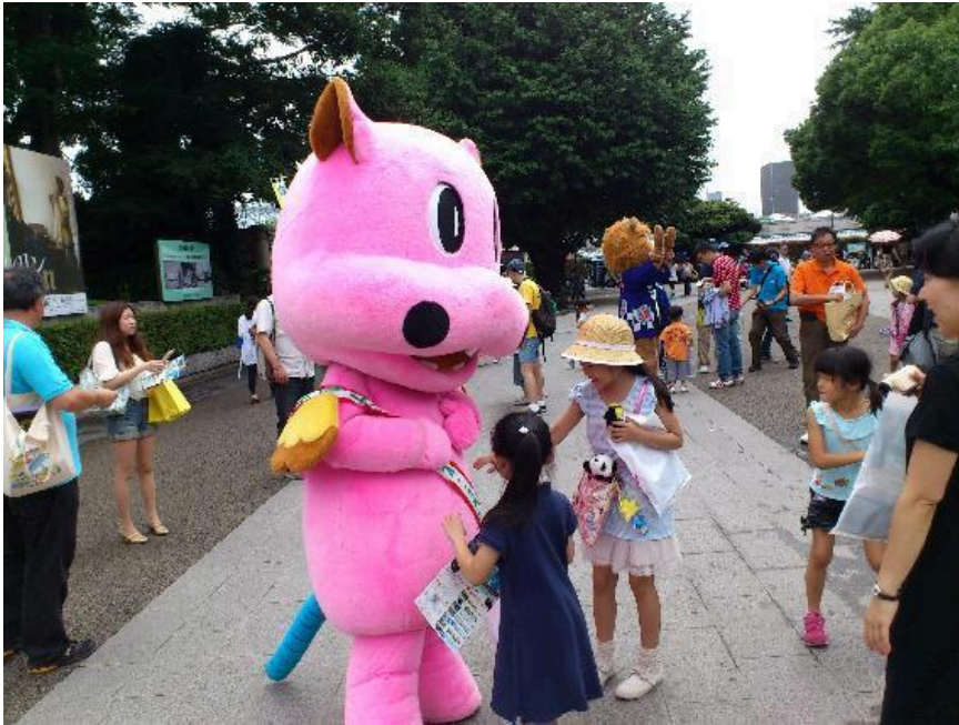
かみねっちょとともに、奥はレオ・で・サファリ

た。それでも、「あ、このかみねっちょ知ってる」とか、「かみね動物園行ったことあるよ」などと言われるとやはりうれしくなります。