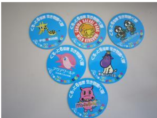
マグネットシート勢ぞろい

この6園館をめぐる各園館でスタンプを押し、それぞれのマグネットシートがもらえます。