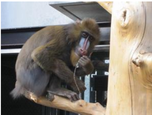
わしも応援しとるヨ

このサルの楽園は、プロポーザル方式といういわば提案競技で設計者を決めました。市民も入れた設計者選定会議でも様々な仕掛けが高い評価を受けたわけですが、現実はまだ予想したものとはなっていません。しかしこのつり橋も、実は日本モンキーセンターではすでに導入実績があり、まったく渡らないということではないと思います。事実タワーの上までは上がってきて、つり橋方向を眺めたりしています（特に夕方）。彼らにも動機がないと渡らないのかもしれませんが、ここはサルと人間の知恵比べ、がまん比べといったところでしょうか。いずれ渡った時にはまたこちらで報告します。