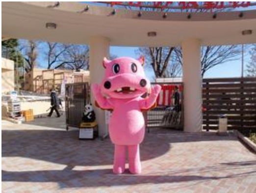
ぼくの仲間が来るよ

曜日) 群馬サファリパークで、3回目が7月10日(日曜日) かみね動物園で、時間はいずれも11時からです。各園館の着ぐるみキャラクターがやってきて記念撮影やプレゼントがありますのでぜひお越し下さい。