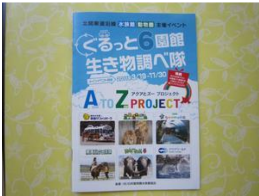
クイズのついたスタンプラリー