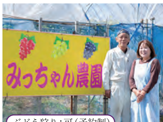
ぶどう狩り:可(予約制)