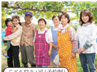
ぶどう狩り:可(予約制)