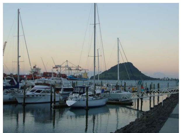
タウランガ市内のマリーナ