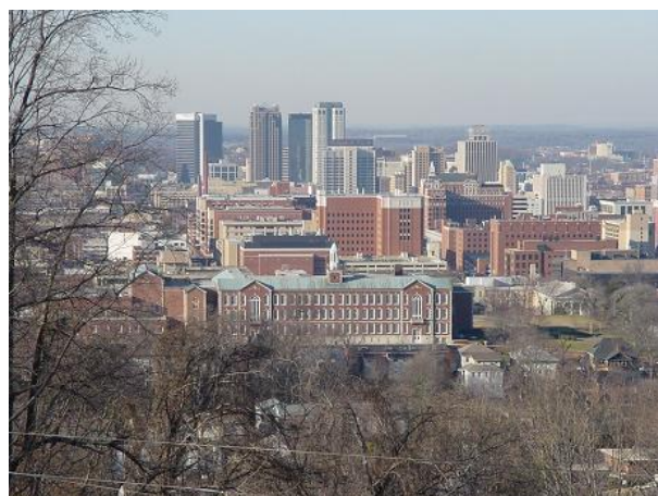
バーミングハム市の中心市街地