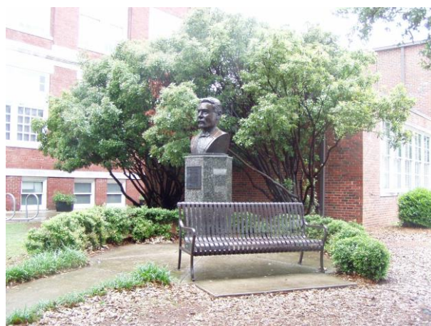
サミュエル・ウルマンの胸像