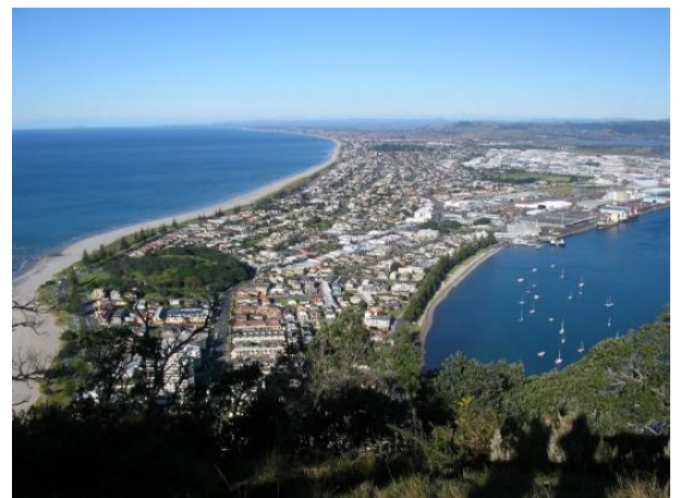
タウランガ市全景