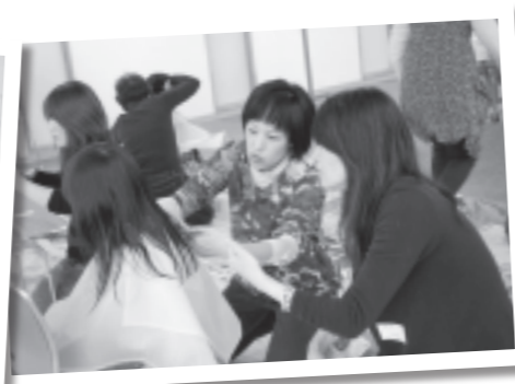
専門的な切り方を学べてとても参考になりました。前より上手に切る事ができそう(参加者の声)