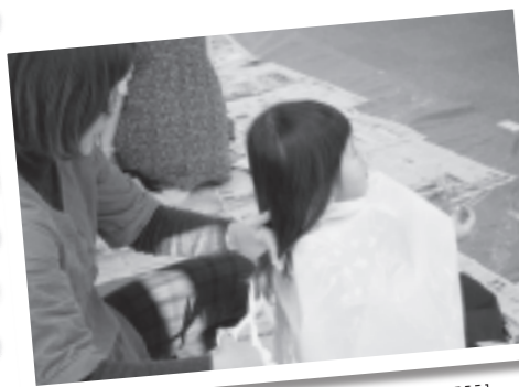
先生が子供の対応に慣れていて指導して下さったのでやりやすかった(参加者の声)

後半は、参加した女の子をモデルに、おだんごやフィッシュボーン、菓三つ編みなどのヘアアレンジの仕方をレクチャー。最後はお茶を飲みながらおきあいあいとおしゃべりを楽しみました。