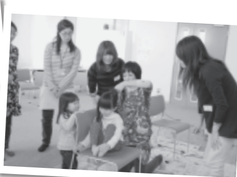
おだんごヘアや編みこみを見学できたので、いつも2本しぼりの娘に試してみたいと思います。(参加者の声)