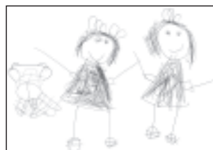
「なかよしおひめさま」