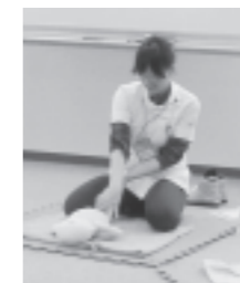
先生のリズムカルで 楽しい実演♪

ベビマの効果や赤ちゃんのお肌のお話から始まり、実際にマイベビーマッサージ♪ 「赤ちゃんとのスキンシップと考えると、日常的に取り入れやすくなります♪ママも赤ちゃんも笑顔になれることが一番大切。」と先生。 「家に帰ってからもチャレンジしてみたいです!」と参加者。