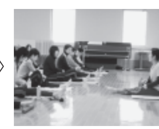
最初は緊張気味だった参加者も終わる頃には汗をかいてリラックスした表情になっていました。