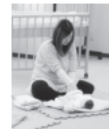
プレママもお人形で 体験です♪