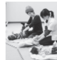
マッサージを受けて気持ちよさそうな赤ちゃん♪