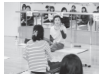
ストレッチをしながら先生のお話を聞きます。

癒しのBGMと先生の穏やかなお声が、参加者をまったりとした空間へ。普段の喧騒を忘れ、自身の心身だけに集中すること一時間。「意外に時間が短く感じました。」「一瞬“無”になれて気分転換できました。」と参加者。「またやって欲しい!」という嬉しい要望もいただきました。