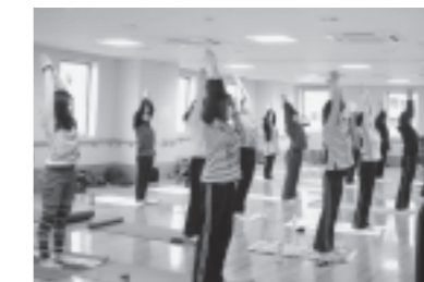
中盤からポーズが難しくなってきた、会場内も熱くなりました。