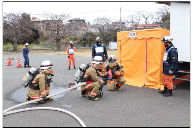
建物火災屋内進入訓練