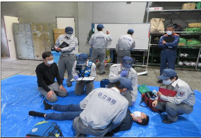
救急シミュレーション訓練