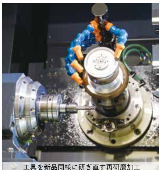
工具を新品同様に研ぎ直す再研磨加工