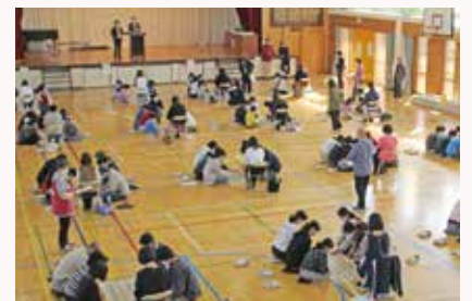
郷土かるた大会の様子