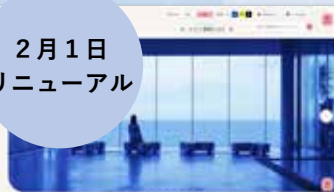
日立市観光物産協会