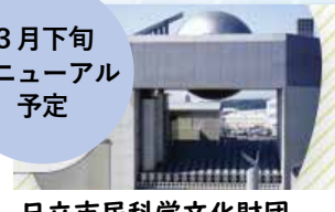
日立市民科学文化財団 (日立シビックセンター、市民会館)