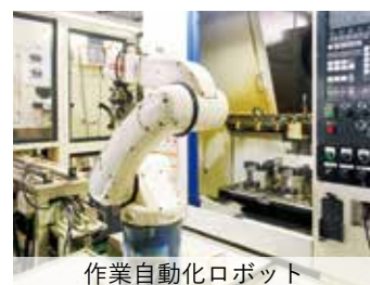
作業自動化ロボット