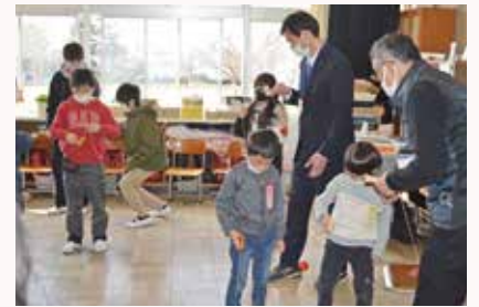
学校子ども会の様子