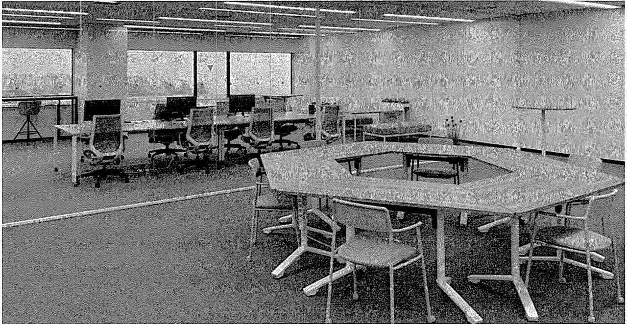
住民とのワークショップ実施などを想定した「協創エリア」を含む専用プロジェクトルームの様子

株式会社日立製作所(以下、日立)は、日立市とともに取り組む次世代未来都市(スマートシティ)の実現に向けた共創プロジェクト* 1 (以下、プロジェクト)の推進を一層加速するため、日立駅前のライブビルに、ひたち協創プロジェクト推進本部の専用プロジェクトルームを7月1日に開設します。