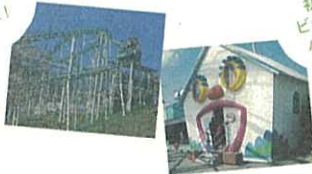
かみねレジャーランド開園