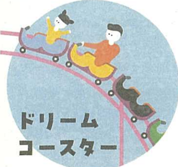
ドリーム コースター

みなさんも一度は乗ったことがある あのお馴染みアトラクション、実はすごかった!?