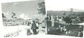
神峰動物園・遊戯施設 (今のかみね遊園地)が開園