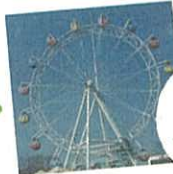
かみねレジャーランド拡張 現在のレジャーランドの姿に