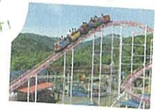
かみねレジャーランド 開園40周年!