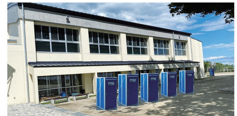
久慈小学校に新たに設置したマンホールトイレ