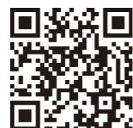
水道使用に係る電子申請