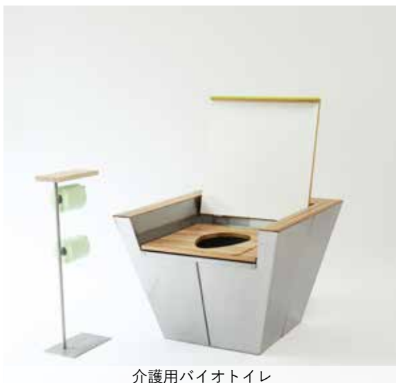
介護用バイオトイレ