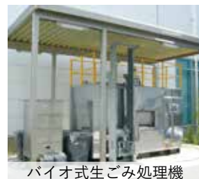
バイオ式生ごみ処理機

2代目社長となった後は、他社が真似できない高い技術を誇る薄型コイルによるICタグ事業などの既存の事業のほか、人工衛星の姿勢制御を行うためのリアクションホイール用モータの開発や、デザイナーと組んだ介護用バイオトイレの海外販路開拓など、時代に合わせて新たな事業展開に取り組んでいます。