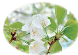
煙害に強いとされる オオシマザクラ