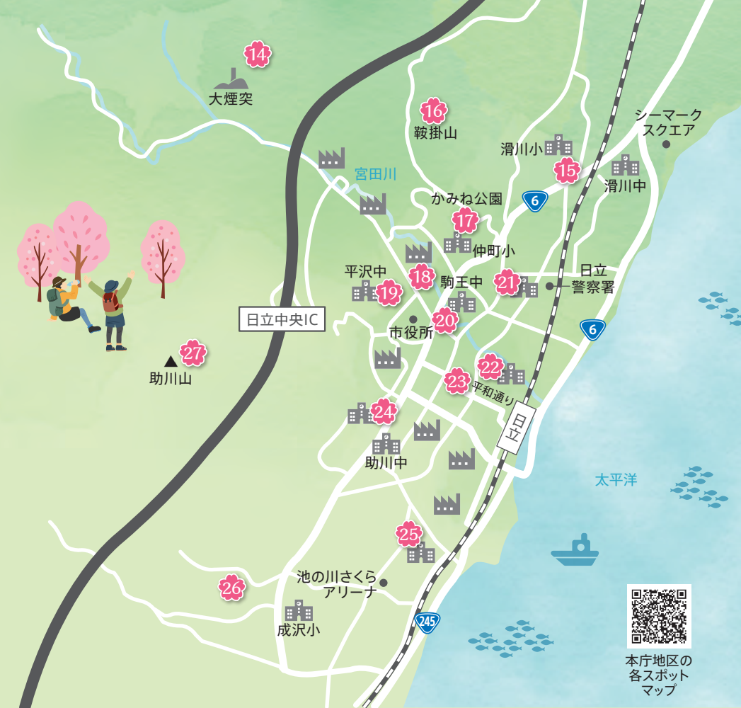
16 鞍掛山 (P7参照) 17 かみね公園 (P5参照) 23 平和通り (P3参照) (日立を代表する桜の名所)

平成3(1991)年に起きた山林火災により大規模被害を受けた森は、自然の驚異的な力で回復し、今では人の心を魅了する美しい風景を見せてくれます。