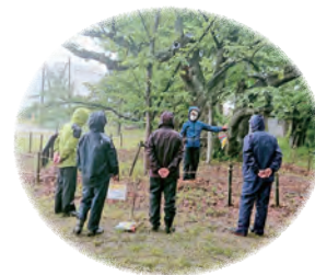
名木の保全と樹勢回復