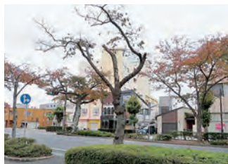
樹勢が衰え健全度が低下した桜