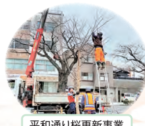
平和通り桜更新事業