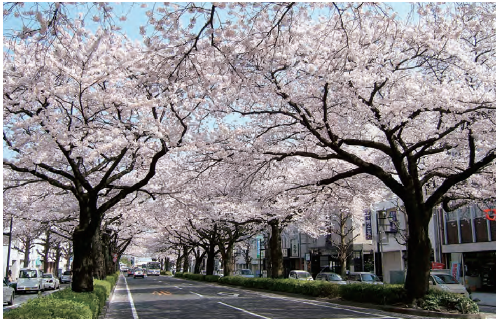
日立を代表する平和通りの桜並木