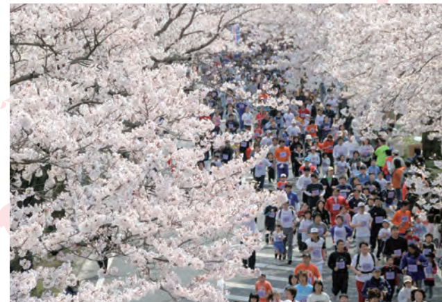
桜のトンネルを駆け抜けるランナー

「日立さくらロードレース」では、親子連れから本格派までたくさんの方々が、桜のトンネルの下を駆け抜けます。また、普段、歩行者は立ち入れない「日立シーサイドロード(国道6号日立バイパス)」もコースの一部になっており、ランナーたちは海の上を走っているような絶景を眺めながらゴールを目指します。