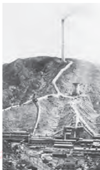
大煙突と荒廃化した山々 (大正中期)

また、植林と同時に周辺地域の希望者に、大正4(1915)年度から昭和12(1937)年度の23年間で、約500万本もの苗木(うちオオシマザクラは約72万本)が無償で配布され、これらが日立の桜のルーツとなりました。