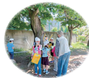
「さくら教室」の開催