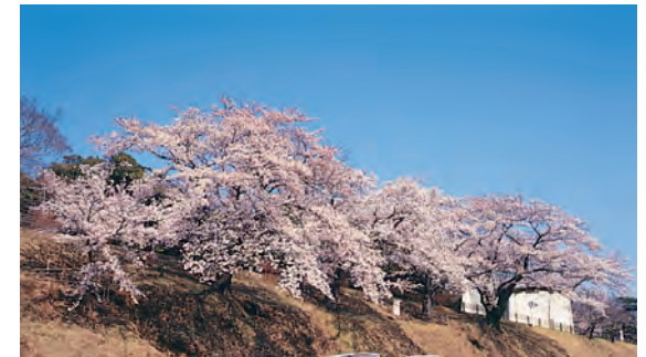
開花を宣言する「標本木」

日立市の桜の開花は、かみね公園南駐車場にある標本木の開花状況を観測し、日立市天気相談所が毎年発表を行っています。