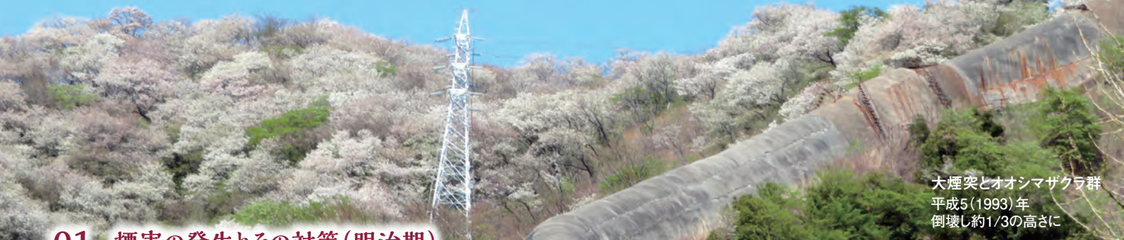
大煙突とオオシマザクラ群 平成5(1993)年 倒壊し約1/3の高さに

日立の桜の歴史をたどるとき、日立鉱山の創業、煙害の発生、そして企業の対策と住民との関わりを抜きにしては語れません。