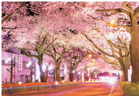
平和通りのライトアップ