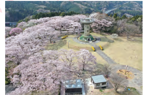
上空から見た園内の様子

十王ダムを見下ろす高台にある十王パノラマ公園。公園のシンボルとして建設された高さ20mのUFO型展望台の最上部からは、眼下に十王ダム湖を満開の桜越しに眺望することができます。面積約4.4haの園内にはソメイヨシノやヤマザクラ、ジュウガツザクラ、フユザクラなど35種約400本の桜があり、長い間花を楽しむことができます。