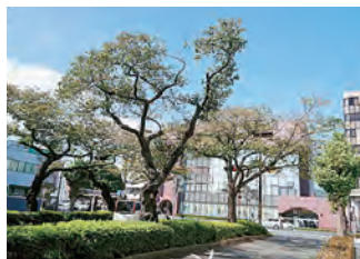
平和通り古木の様子

近年では、植樹されてから長い年月を経ている桜が、病気の影響などにより空洞ができて、枯枝が増えたりするなど、樹勢が衰えている状況が多く見られます。