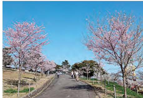
植替え後の桜並木

鞍掛山の山裾に続いているなだらかな丘陵地に広がっているのが「かみね公園」(広さ約15ha)です。昭和28(1953)年に開園した総合公園であり、日立市の中心部に位置し、園内の各所からは市街地や太平洋、周囲の山並みの眺望を楽しむことができます。園内外には、日立市固有の早咲き桜である日立紅寒桜や日本で広く植樹されているソメイヨシノ、4月中旬頃から咲くサトザクラなど約1,000本の桜が咲き誇ります。中には「ギョイコウ(御衣黄)」という黄緑色の花を咲かせる珍しい桜もあり、見る人の目を楽しませてくれます。また、4月上旬から下旬にかけ、園内の展望台からは、桜色に染まった市内を一望することができます。