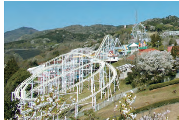
かみね公園頂上展望台から望む