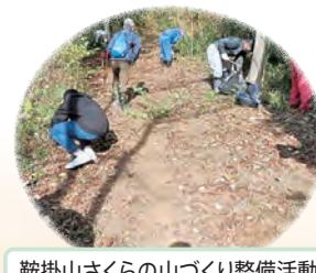
鞍掛山さくらの山づくり整備活動