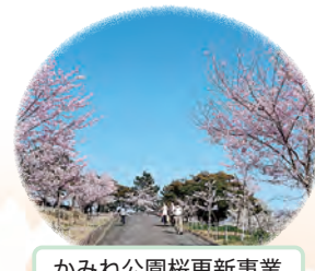
かみね公園桜更新事業