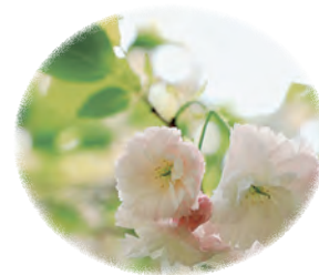
SNSを活用した桜の情報発信