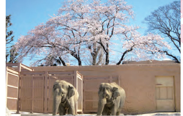
アットホームな動物園

近年では、生き生きとしたチンパンジーの行動が見られる「チンパンジーの森」、爬虫類とウミウの展示を組み合わせた「はちゅういぬ館」、猛獣の迫力を身近に楽しめる新猛獣舎「がおーこく」などの新しい獣舎が続々オープンするなど、日立市を代表する観光拠点となっています。