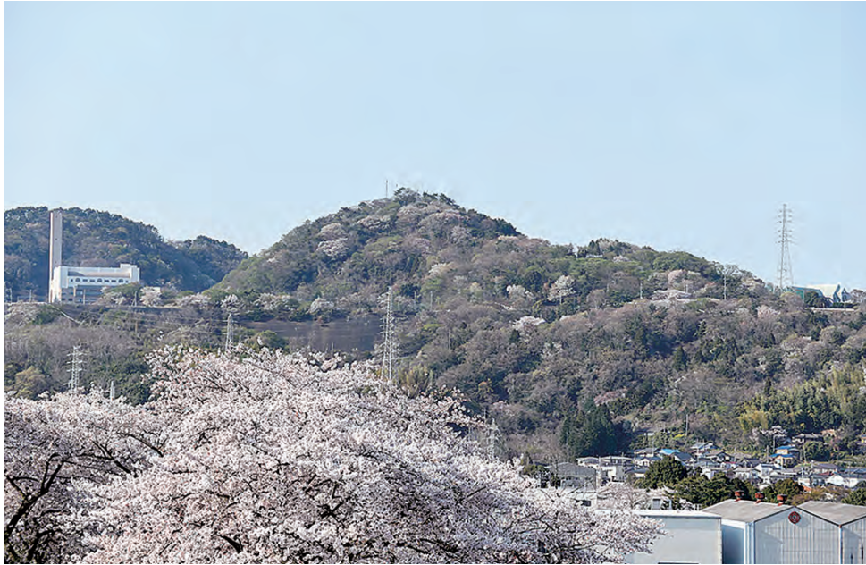
中央に小高く見える鞍掛山

鞍掛山は、標高247.2mの小高い山です。煙害により大きな被害を受けた鞍掛山は、荒廃化した山林の自然を再生する目的で、企業と市民が協働して桜を植え始めたことが、さくらのまち日立の始まりです。約100年前の植林により、オオシマザクラの子孫など約520本の桜が現在も息づく貴重な山です。