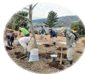
地域コミュニティによる桜を守り育てる体制づくり

さくらのまちづくり実現に向け、「ひたちさくら彩(いろ)プラン」の基本施策に基づき、活動に取り組んでいます。