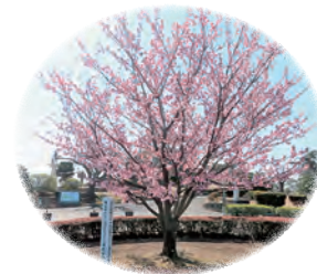
「ひたちらしさ」を演出する市固有の桜名所づくり