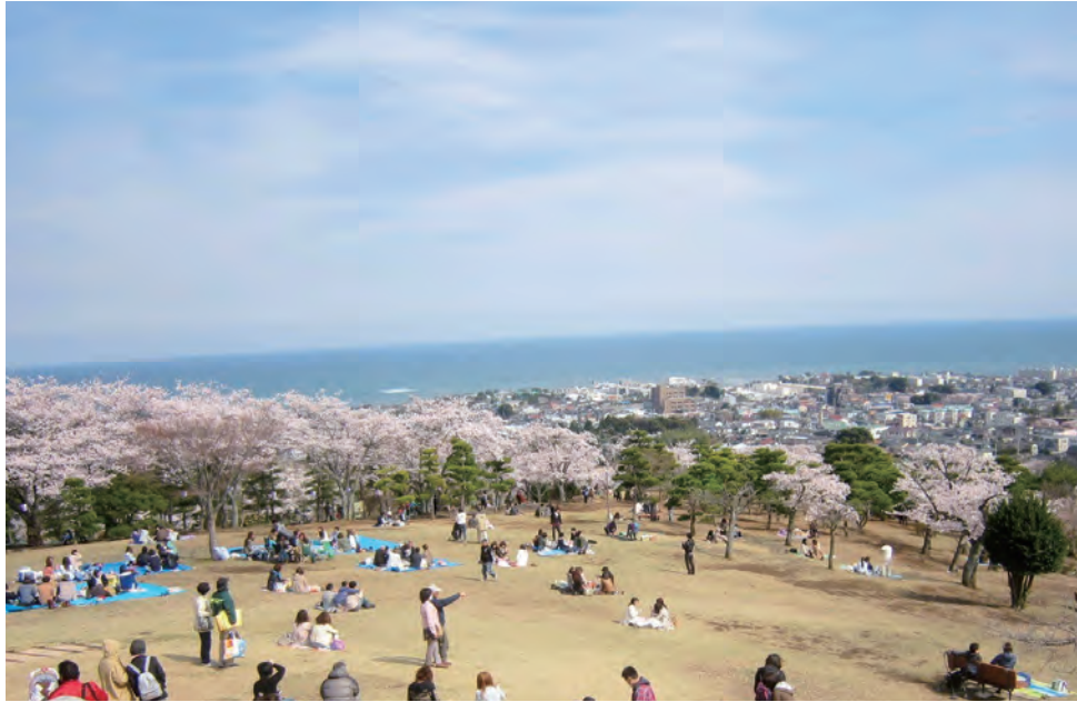
かみね公園頂上広場の様子