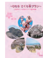
「ひたちさくら彩(いろ)プラン」