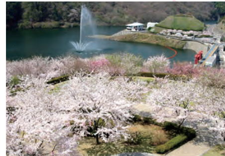
十王ダム湖を望む