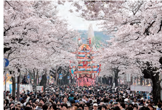
桜と伝統芸能の祭典

平和通り・かみね公園・十王パノラマ公園を会場に繰り広げられるさくらまつりは、伝統芸能である「日立風流物」(国指定重要有形・無形民俗文化財。ユネスコ無形文化遺産。高さ15m、奥行7m、幅3～8m、重さ5tの山車でからくり仕掛けの人形芝居を披露する)や「日立のささら」(県指定無形民俗文化財、水木・諏訪・成沢・助川・会瀬・宮田・大久保の7地区に江戸時代から伝わっている獅子舞)の公開などのイベントが催され、夜には平和通りのライトアップ、かみね公園や十王パノラマ公園では、ぼんぼり点灯による光の彩をお楽しみいただけます。