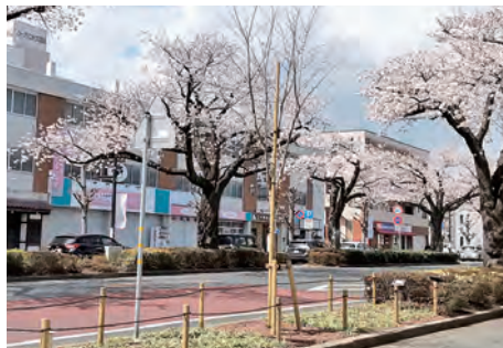
若木植樹後の様子

平和通りは、戦後の戦災都市復興計画により昭和26(1951)年に全線が開通し、街路樹として地元の人たちの協力によってソメイヨシノが植樹されました。日立駅前から国道6号まで約1kmの日立を代表する桜の名所となっています。かみね公園と合わせて、日本の「さくら名所100選」に選ばれており、見事な桜のトンネルが訪れる多くの人々を魅了します。