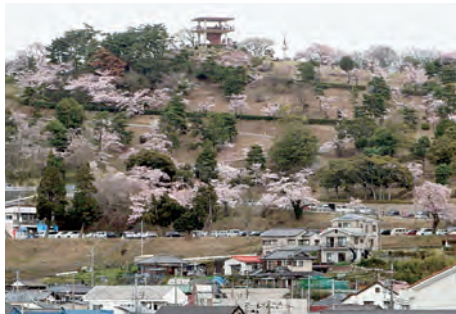
国道6号からの眺望