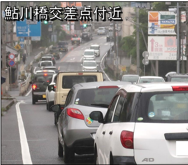
鮎川橋交差点付近