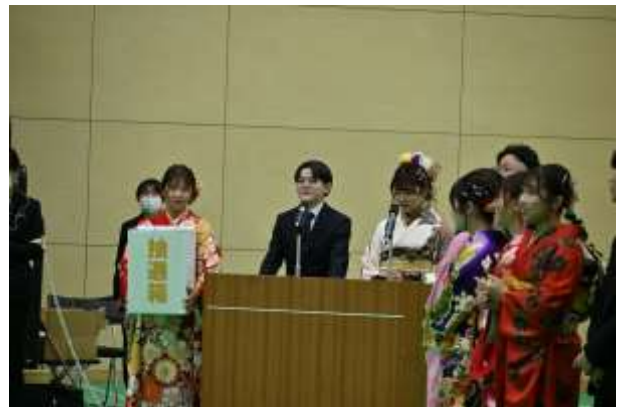
アトラクション（抽選会）の様子