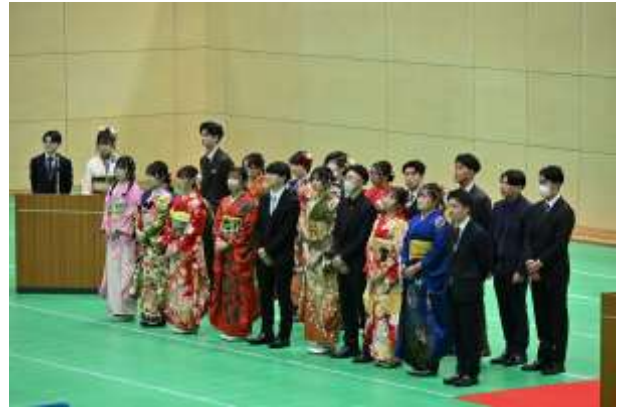
式典を運営する実行委員