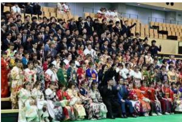
出身中学校ごとの記念撮影