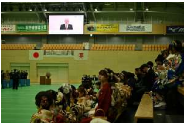
祝辞（市長のビデオメッセージ）