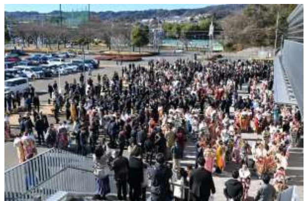
式典後の様子（アリーナ前）