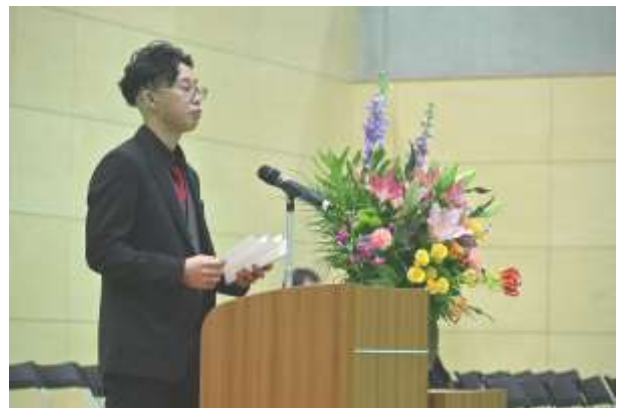
実行委員長の挨拶