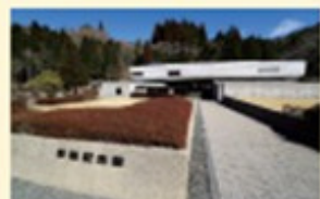
日鉱山の歴史を学べる日鉱記念館