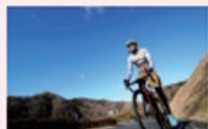
上りは自身のペースで無理せず走って、完走を目指そう