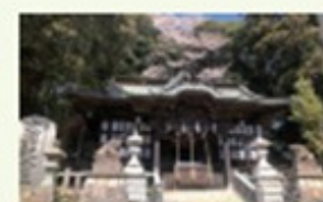
悪縁を断つ縁切りで開運を願う。大甕神社を満喫しよう