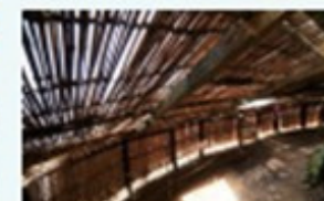
伊豆海沿いのウミウ観望場。一般公開は1~3月、7~9月