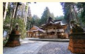
神秘的な雰囲気漂う雪山、御岩山に建つ御岩神社