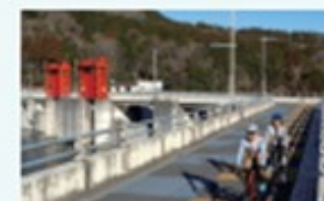
十王ダム。近くのパノラマ公園から太平洋