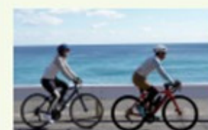
海岸沿いは涼風が気持ちいい。ひたちの海を満喫しよう