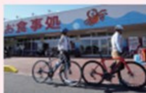
市内の港で水揚げされた魚介類や、野菜などを販売。食事を楽しむ