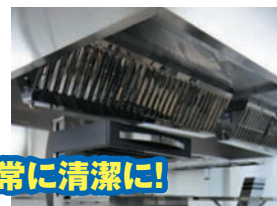
厨房設備は常に清潔に!

清掃、必要な点検及び整備など厨房設備の維持管理は「火災予防条例」で義務づけられています。