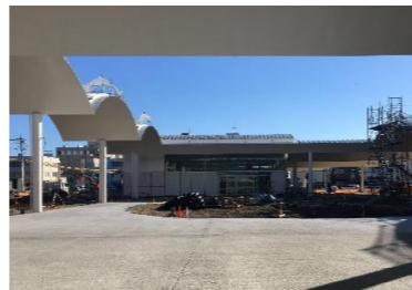
パーミアコンの床

大屋根下の床仕上げは、コンクリート系の透水性舗装（パーミアコン）で整備しています。雨水が浸透しやすい材質で、滑りにくく、安全に歩くことができます。落ち着いたライトグレー色は、憩いの場の雰囲気にマッチしています。