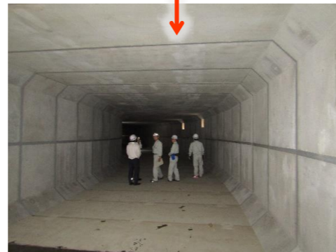
ボックスカルバート内部

数沢川を地中化するためのボックスカルバートの設置が完了しました。今回は、内部で撮影した貴重な写真を公開します。10月初旬には、水路の切り替えを行う予定です。