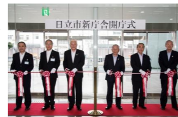
開庁式（テープカット）