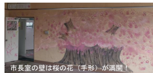
市長室の壁は桜の花（手形）が満開！

解体前の旧庁舎を活用して、お絵かきイベント「ひたちカコ・イマ・ミライ2017」が開催されました。一般参加を募り、旧庁舎の壁や床、窓ガラスに、思い思いに絵やメッセージを残すイベントです。