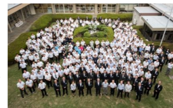
閉庁式（旧庁舎屋上から）

約半世紀に渡り行政の要として市民を見守り続けた旧庁舎への感謝を込めて、7月14日（金）に閉庁式を行いました。 7月18日（火）には、新庁舎での業務開始にあたり、正面玄関前でテープカットを行いました。職員一同気持ちも新たに、より一層の市民サービスに努めます！