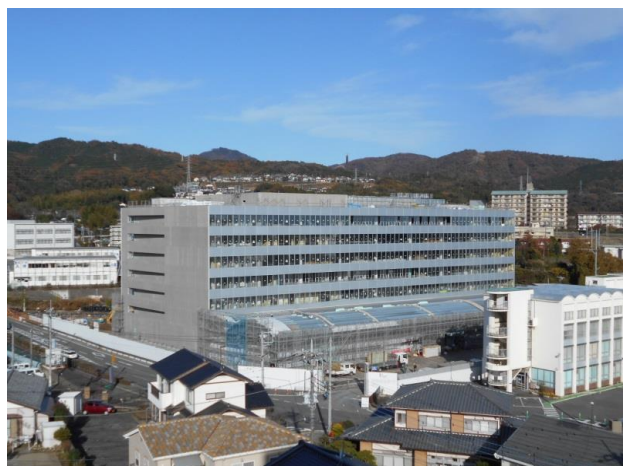
■全体工事風景 南側から工事現場を見ています。