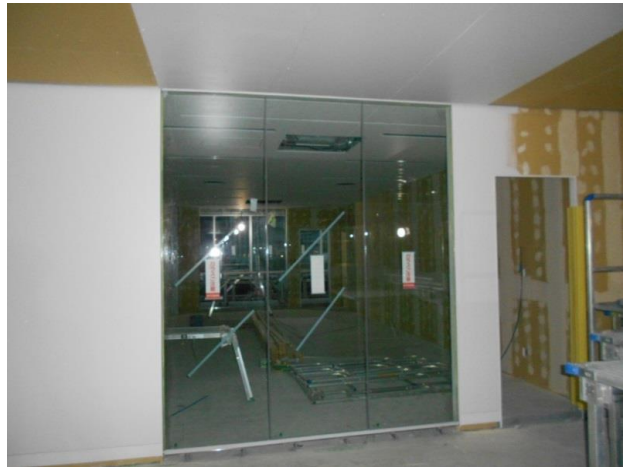
■会議室のガラス間仕切り工事 ガラスの間仕切りを設置後、色合いを確認しながら壁や天井の塗装をしています。