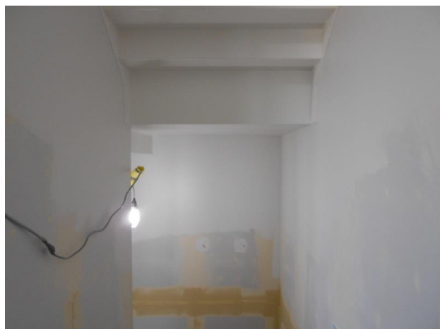
■階段の塗装工事 写真の薄茶色部分は壁ボードの継目処理を行ったものです。その後、塗装を行うと写真上部のようにきれいな仕上がりになります。