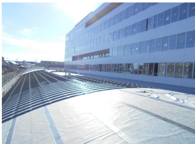
■屋内広場の屋根工事 屋根の仕上げ材を取付けるための下地を施工しています。仕上げ材にはガルバリウム鋼板というアルミと亜鉛の合金メッキ鋼板を使用します。