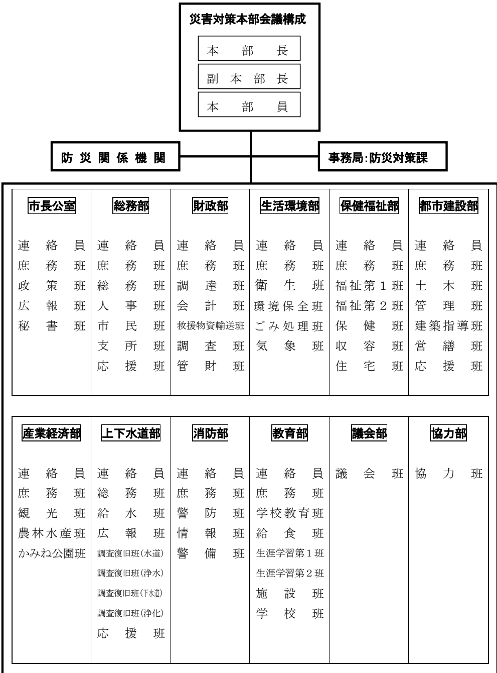
図 2-1 日立市災害対策本部組織図

災害時は、本計画及び地域防災計画に基づき、災害廃棄物処理の組織体制を構築し、指揮系統を確立します。(図 2-1)