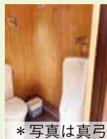
*写真は真弓山頂近くのトイレ

ハイキングコースには、トイレや道標を整備しています。ハイキングコースマップにはトイレや道標の場所が示されているので初心者の方も安心して楽しめます。