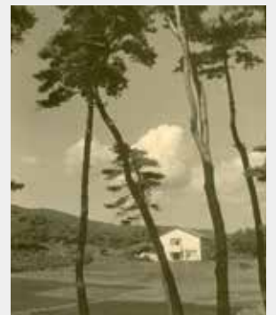
シオンカレッジ本館 （昭和24年）

日立市では、こうした偉大なご功績を広く顕彰するため、平成11年に、ローガンさんに日立市特別名誉市民の称号をお贈りしました。