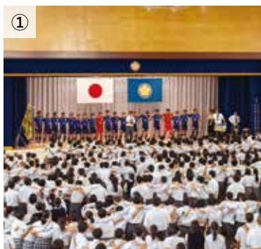
①校内での優勝報告会 ②③日立シビックセンター 新都市広場で市民に優勝を報告