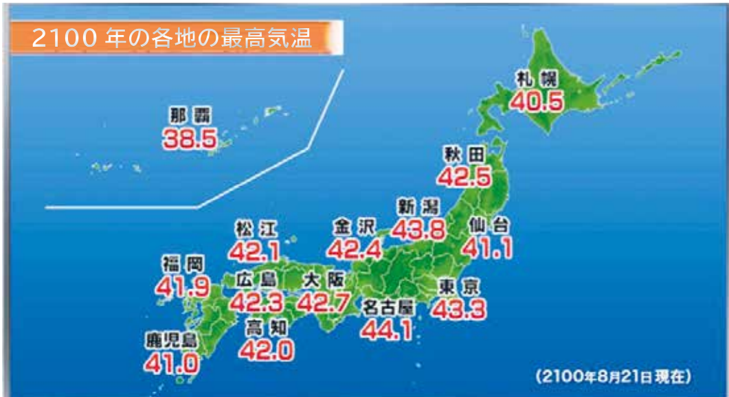
このままでは2100年の最高気温は大変なことに！