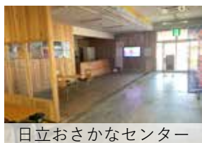
日立おさかなセンター